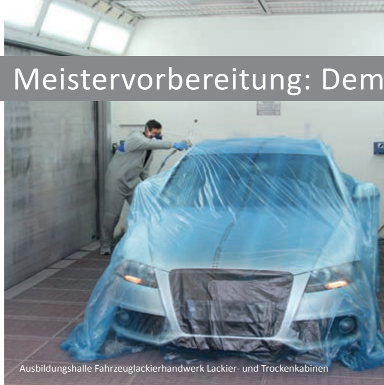
Ausbildungshalle Fahrzeuglackierhandwerk Lackier- und Trockenkabinen

Unsere Ausstattung und die Räumlichkeiten entsprechen den aktuellsten Standards: Neben neuen Boxen für die praktische Aus- und Weiterbildung der Maler und Lackierer und einer Ausbildungshalle mit modernen Lackier- und Trockenkabinen für die Fahrzeuglackierer sind auch die Räumlichkeiten für den theoretischen Unterricht mit versenkbaren Computern ausgestattet.