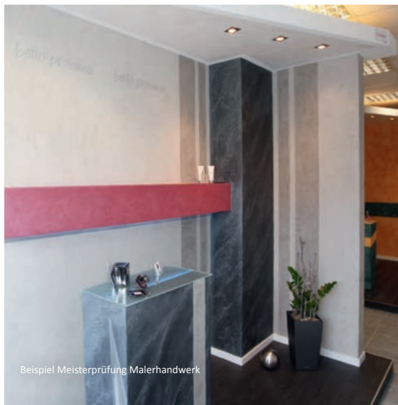
Beispiel Meisterprüfung Malerhandwerk